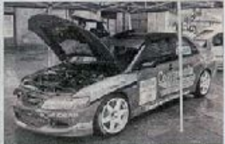
El coche del piloto gallego Luis Moya presentado en el segundo Motorshow Festival en Amla.

El piloto gallego presentó su máquina la última edición del festival de automovilismo en Amla. El piloto gallego presentó su máquina la última edición del festival de automovilismo en Amla. El piloto gallego presentó su máquina la última edición del festival de automovilismo en Amla.